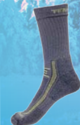
HIKING 66%BAMBUS 32%POLYAMID 2%ELASTAN ŠEDO-ZELENÁ ♂ 4-5, 6-7, 8-9, 10-11 ART. 10153