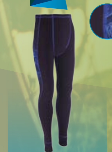
PCE PANTS 95%POLYESTER 5%ELASTAN ČIERNA