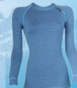
MODAL DLA 70%MODAL 28%POLYPROPYLEN 2%ELASTAN TYRKYSOVÁ S M L XL ART. 85512/1