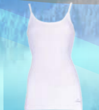
POP SLEEVELESS 100% POLYPROPYLÉN BIELA S M L XL XXL ART. 85428