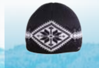
GREY 50% VLNA MERINO 50% POLYACRYL ŠEDO-ČIERNA M L ART. 85628