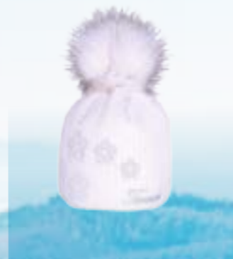
SNOW 50%BAVLNA 50%POLYACRYL VNÚTRO : 100%POLYESTER-FLEECE BIELA UNI ART. 85624