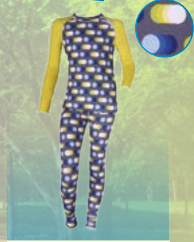
KIDS SET BLUE 95%POLYESTER 5%ELASTAN 120 130 140 150 ART. 85682/1