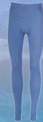
MODAL PANTS 70%MODAL 28%POLYPROPYLÉN 2%ELASTAN MODRÁ ♂ M L XL XXL ART. 85518/1