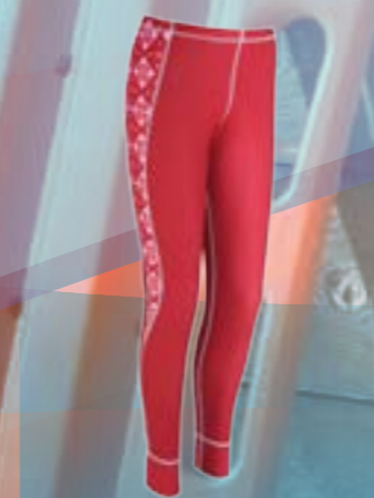
PCE PANTS 95%POLYESTER 5%ELASTAN ČERVENÁ S M L XL ART. 85647