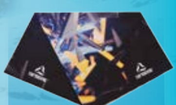
MULTIFUNKČNÝ ŠÁL 95%POLYESTER 5%ELASTAN POTLAČ UNI ART. 85398/9