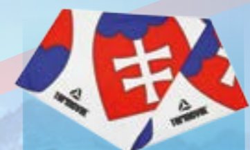
MULTIFUNKČNÝ ŠÁL 95%POLYESTER 5%ELASTAN POTLAČ UNI ART. 85398/2