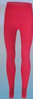
SEAM ROYAL PANTS 50%POLYAMID 38%WOOL MERINO 9%POLYPROPYLEN 3%ELASTAN ČERVENÁ ♂ M/L XL/XXL ART. 85681