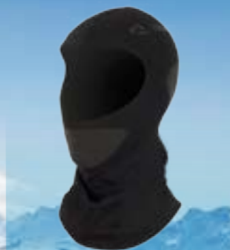
KUKLA SEAM 54%POLYAMID 40%POLYPROPYLÉN 6%ELASTAN ČIERNA UNI ART. 85443