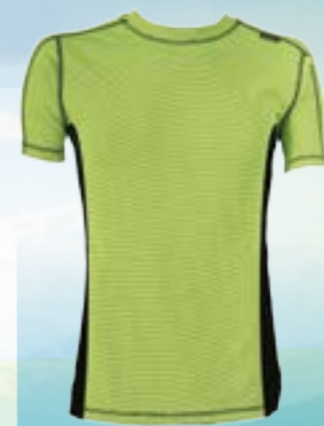
RUN KRA 65%POLYESTER 35%POLYPROPYLÉN NEÓNOVÁ/ČIERNA ♂ M L XL XXL ART. 85671