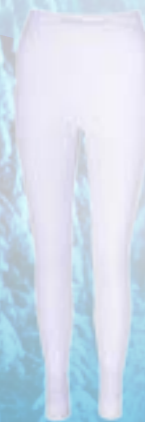
SEAM ROYAL PANTS 50%POLYAMID 38%WOOL MERINO 9%POLYPROPYLÉN 3%ELASTAN BIELOSIVÁ ♀ S/M L/XL ART. 85675