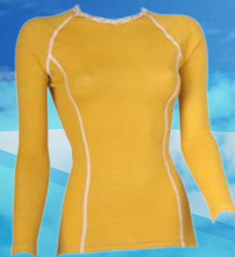
WOOL DLR 80%VLNA 20%POLYPROPYLÉN OKROVÁ