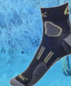
RAPID 69%COOLMAX 29% POLYAMID 2%ELASTAN ČIERNO-ZELENÁ ♂ 4-5, 6-7, 8-9, 10-11 ART. 10139