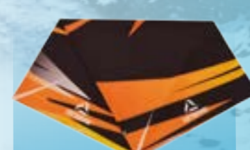
MULTIFUNKČNÝ ŠÁL 95%POLYESTER 5%ELASTAN POTLAČ UNI ART. 85398/8