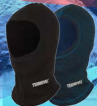
KUKLA DETSKÁ 50%BAVLNA 50%POLYPROPYLÉN ČIERNA, MODRÁ UNI ART. 85152