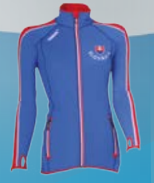
POWER SLOVAKIA 86%POLYAMID 14%ELASTAN MODRO ČERVENÁ BIELA ♀ S M L XL XXL ART. 85537