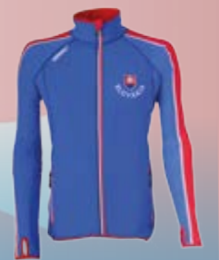
POWER SLOVAKIA 86%POLYAMID 14%ELASTAN MODRO ČERVENÁ BIELA ♂ S M L XL XXL XXXL ART. 85536