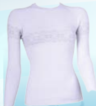
SEAM ROYAL DLR 50%POLYAMID 38%WOOL MERINO 9%POLYPROPYLÉN 3%ELASTAN BIELOSIVÁ ♀ S/M L/XL ART. 85674