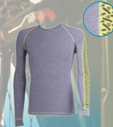
TERM DLR 95%POLYESTER 5%ELASTAN ŠEDÝ MELÍR