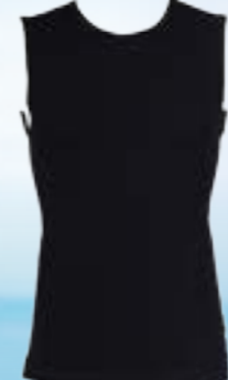
MODAL SCAMPOLO 70%MODAL 28%POLYPROPYLÉN 2%ELASTAN ČIERNA ♂ M L XL XXL ART. 85404/4