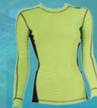
RUN DLR 65%POLYESTER 35%POLYPROPYLÉN NEÓNOVÁ/ČIERNA ♀ S M L XL ART. 85672