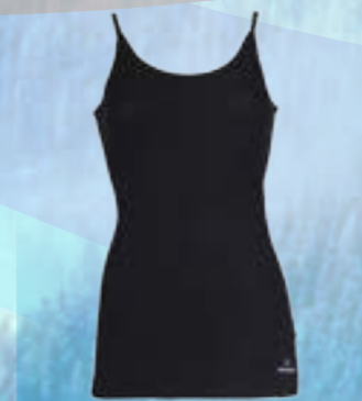
POP SLEEVELESS 100% POLYPROPYLÉN ČIERNA S M L XL XXL ART. 85428/1