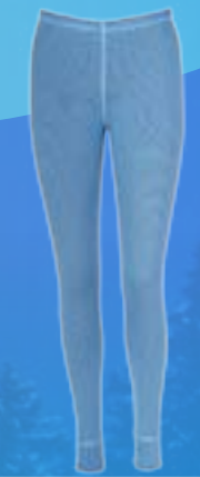
MODAL PANTS 70%MODAL 28%POLYPROPYLEN 2%ELASTAN TYRKYSOVÁ S M L XL ART. 85514/1