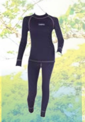
KIDS SET 95%POLYESTER 5%ELASTAN GRAFIT 120 130 140 150 ART. 85592/1