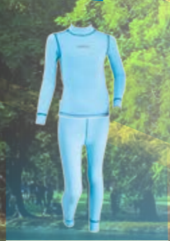
KIDS SET BABY 95%POLYESTER 5%ELASTAN MODRÁ 90 100 110 ART. 85592/1