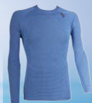
MODAL DLR 70%MODAL 28%POLYPROPYLÉN 2%ELASTAN MODRÁ ♂ M L XL XXL ART. 85516/1