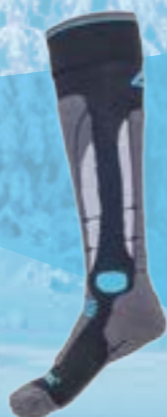
PODKOLIENKY SKI 39%THERMOCOOL 29%POLYAMIDMICROLON 24%POLYAMID 5%POLYPROPYLEN SILTEX 3%ELASTAN ČIERNO-TYRKYSOVÁ ♂ 4-5, 6-7, 8-9, 10-11 ART. 10160