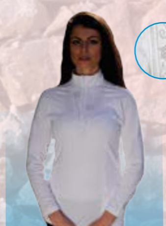
ROLÁK STRIKE 86% POLYAMID 14% ELASTAN BIELA