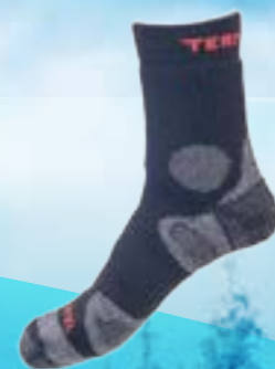
TREKING MID 40%TERMOCOOL 36%BAVLNA 21%POLYAMID 3%ELASTAN ČIERNO-ČERVENÁ ♂ 4-5, 6-7, 8-9, 10-11 ART. 11921