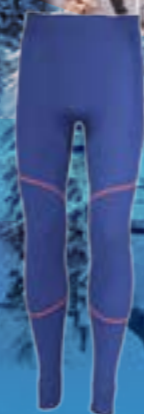
WINTER SKI PANTS 100%POLYPROPYLEN 100%POLYESTER MODRÁ/ORANŽOVÁ ♂ S M L XL ART. 85694