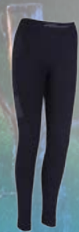
SEAM BIONIC PANTS 54%POLYAMID 40%POLYPROPYLEN 6%ELASTAN ČIERNÁ ♂ M/L XL/XXL ART. 85679