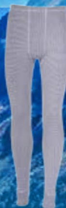
MODAL PANTS 70%MODAL 28%POLYPROPYLÉN 2%ELASTAN ŠEDÁ ♂ M L XL XXL ART. 85518/3