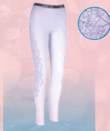
PCE LACE PANTS 95% POLYESTER 5% ELASTAN ŠEDORUŽOVÁ