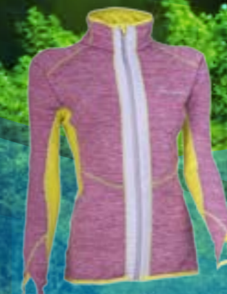
MIA 86%POLYAMID 14%ELASTAN RUŽOVÝ MELÍR/NEONOVA ART. 85667 S M L XL