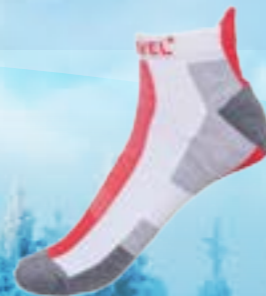
RUNNING 39%COOLMAX 34%POLYAMID 25%POLYAMID MICROLON 2%ELASTAN ČERVENÉ ♂ 4-5, 6-7, 8-9, 10-11 ART. 10122/1