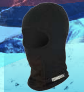
KUKLA PCE 95%POLYESTER 5%ELASTAN ČIERNA UNI ART. 85416