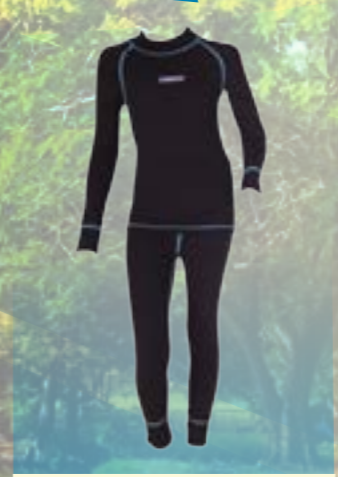
KIDS SET 95%POLYESTER 5%ELASTAN ČIERNA 120 130 140 150 160 ART. 85592