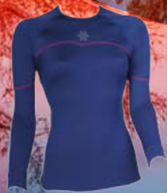
WINTER SKI DLR 100%POLYPROPYLEN 100%POLYESTER MODRÁ/RUŽOVÁ ♀ S M L XL ART. 85695