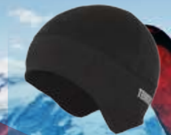
PCE CAP 95%POLYESTER 5%ELASTAN ČIERNA UNI ART. 85153