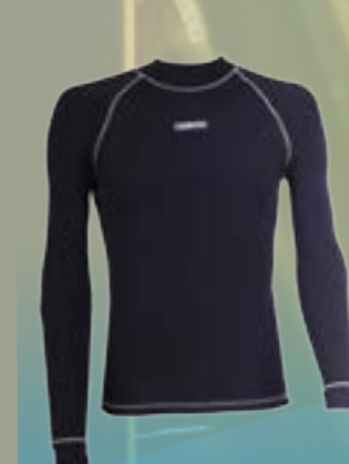
PCE LONG 95%POLYESTER 5%ELASTAN ČIERNA