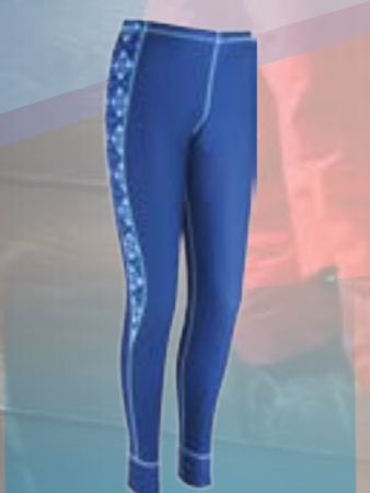
PCE PANTS 95%POLYESTER 5%ELASTAN MODRÁ S M L XL ART. 85647/1