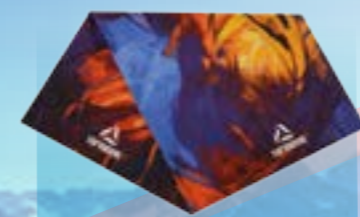
MULTIFUNKČNÝ ŠÁL 95%POLYESTER 5%ELASTAN POTLAČ UNI ART. 85398/1