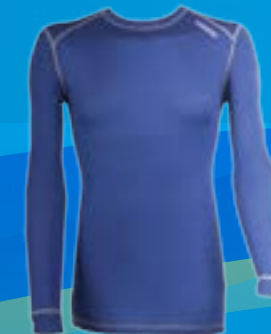
WOOL DLR 70%VLNA 30%POLYPROPYLEN MODRÁ ♂ M L XL XXL ART. 85520/1