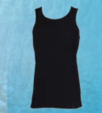
POP SLEEVELESS 100% POLYPROPYLÉN ČIERNA M L XL XXL XXXL ART. 85623/1