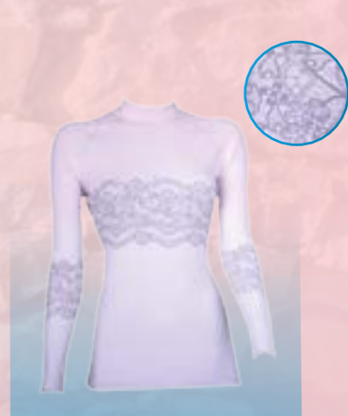
PCE LACE 95% POLYESTER 5% ELASTAN ŠEDORUŽOVÁ