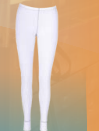
PCE PANTS 95%POLYESTER 5%ELASTAN BIELA S M L XL ART. 85528/1