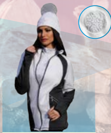
MIKINA EDGE 70% POLYESTER 25% POLYAMID NYLON 5% LYCRA BIELO-ŠEDÁ