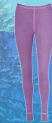
MODAL PANTS 70%MODAL 28%POLYPROPYLEN 2%ELASTAN FIALOVÁ S M L XL ART. 85514