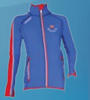
KIDS POWER SLOVAKIA 86%POLYAMID 14%ELASTAN MODRO ČERVENÁ BIELA 110 120 130 140 150 ART. 85538