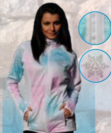
MIKINA CUT 90% POLYESTER 10% ELASTAN BIELO-RUŽOVO-ZELEŇÁ