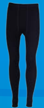
WOOL PANTS 70%VLNA 30%POLYPROPYLEN ČIERNÁ ♂ M L XL XXL ART. 85521