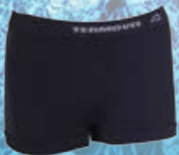
SEAM LADY SLIP 54%POLYAMID 40%POLYPROPYLÉN 6%ELASTAN ČIERNA ♀ S/M L/XL ART. 85330