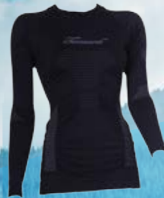
SEAM BIONIC DLR 54%POLYAMID 40%POLYPROPYLÉN 6%ELASTAN ČIERNA ♀ S/M L/XL ART. 85676