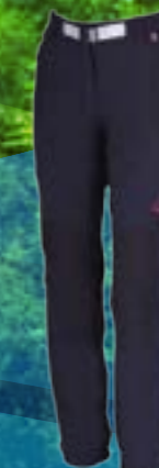
KAIRA 92%POLYAMID 8%SPANDEX ČIERNA ART. 85668 S M L XL