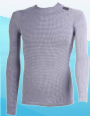
MODAL DLR 70%MODAL 28%POLYPROPYLÉN 2%ELASTAN ŠEDÁ ♂ M L XL XXL ART. 85516/3