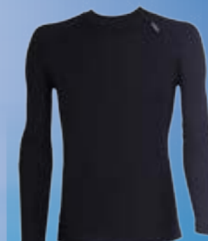
MODAL DLR 70%MODAL 28%POLYPROPYLÉN 2%ELASTAN ČIERNA ♂ M L XL XXL ART. 85516