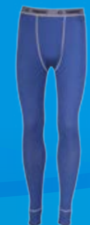
WOOL PANTS 70%VLNA 30%POLYPROPYLEN MODRÁ ♂ M L XL XXL ART. 85521/1