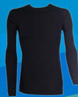
WOOL DLR 70%VLNA 30%POLYPROPYLEN ČIERNÁ ♂ M L XL XXL ART. 85520