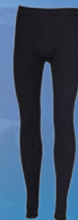
MODAL PANTS 70%MODAL 28%POLYPROPYLÉN 2%ELASTAN ČIERNA ♂ M L XL XXL ART. 85518