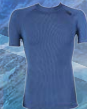
MODAL KAR 70%MODAL 28%POLYPROPYLÉN 2%ELASTAN MODRÁ ♂ M L XL XXL ART. 85517