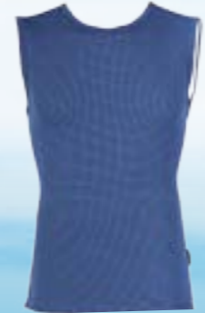
MODAL SCAMPOLO 70%MODAL 28%POLYPROPYLÉN 2%ELASTAN MODRÁ ♂ M L XL XXL ART. 85404