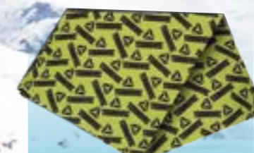
MULTIFUNKČNÝ ŠÁL 95%POLYESTER 5%ELASTAN POTLAČ UNI ART. 85398/6