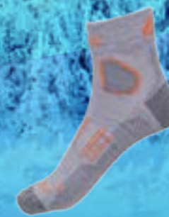
RAPID 69%COOLMAX 29% POLYAMID 2%ELASTAN ŠEDO-ORANŽOVÁ ♂ 4-5, 6-7, 8-9, 10-11 ART. 10139/1