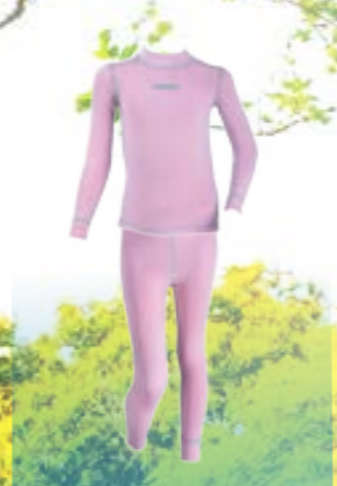
KIDS SET BABY 95%POLYESTER 5%ELASTAN RUŽOVÁ 90 100 110 ART. 85591