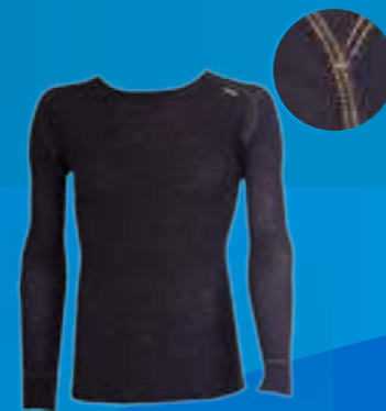
ACTIVE LONG 100%VLNA ČIERNÁ ♂ S M L XL XXL ART. 85691