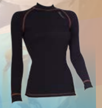
PCE LONG 95%POLYESTER 5%ELASTAN ČIERNA S M L XL ART. 85527