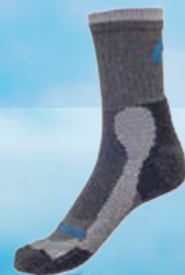
TREKING LIGHT 40%TERMOCOOL 36%BAVLNA 21%POLYAMID 3%ELASTAN ŠEDO-MODRÁ ♂ 4-5, 6-7, 8-9, 10-11 ART. 11914