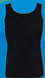
TIELKO ACTIVE 100%VLNA ČIERNÁ ♂ S M L XL XXL ART. 85689