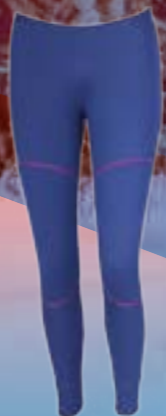
WINTER SKI PANTS 100%POLYPROPYLEN 100%POLYESTER MODRÁ/RUŽOVÁ ♀ S M L XL ART. 85686