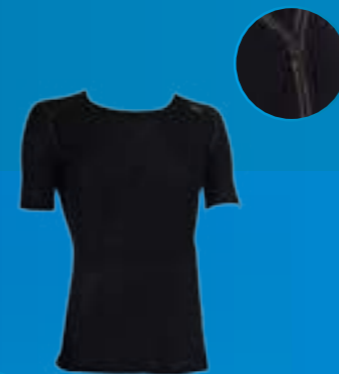
TRIČKO ACTIVE 100%VLNA ČIERNÁ ♂ S M L XL XXL ART. 85690