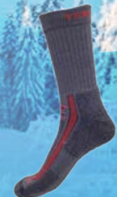
HIKING 66%BAMBUS 32%POLYAMID 2%ELASTAN ŠEDO-ČERVENÁ ♂ 4-5, 6-7, 8-9, 10-11 ART. 10153/1