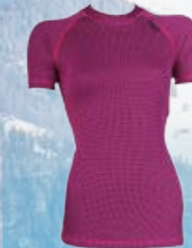
MODAL KRR 70%MODAL 28%POLYPROPYLEN 2%ELASTAN RUŽOVÁ S M L XL ART. 85427