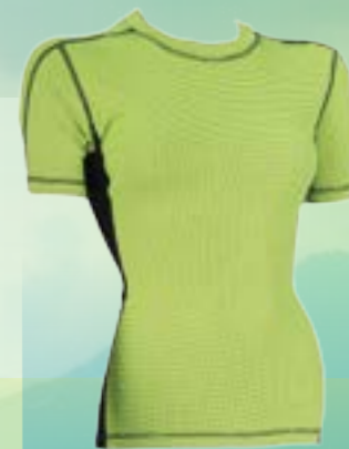
RUN KRA 65%POLYESTER 35%POLYPROPYLÉN NEÓNOVÁ/ČIERNA ♀ S M L XL ART. 85673