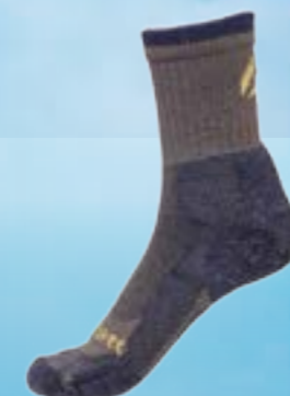
TREKING LIGHT 40%TERMOCOOL 36%BAVLNA 21%POLYAMID 3%ELASTAN ZELENO-ŽLTÁ ♂ 4-5, 6-7, 8-9, 10-11 ART. 11914/1