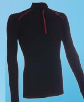
WOOL ROLL 70%VLNA 30%POLYPROPYLEN ČIERNA ♂ M L XL XXL ART. 85375