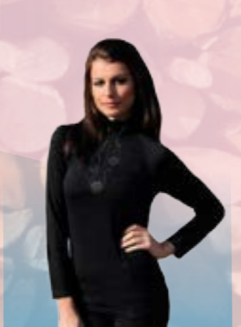
ROLÁK STRIKE 86% POLYAMID 14% ELASTAN ČIERNA