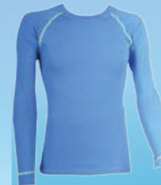
OVERLAY 65%BAVLNA 35%POLYPROPYLEN MODRÁ ♂ M L XL XXL ART. 85664