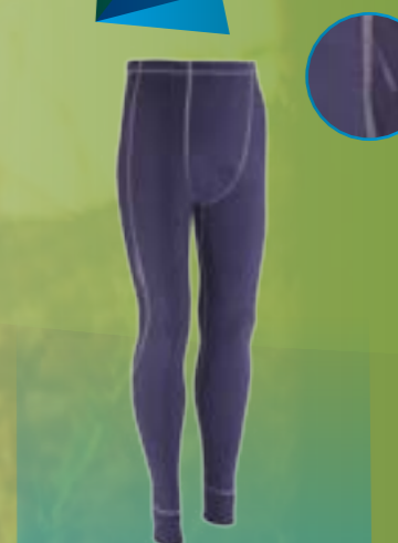
PCE PANTS 95%POLYESTER 5%ELASTAN GRAFITOVÁ