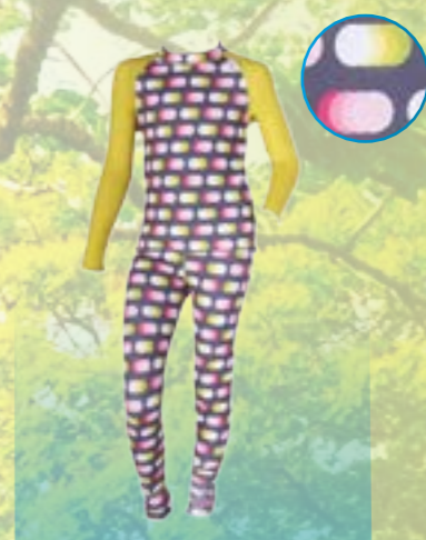
KIDS SET PINK 95%POLYESTER 5%ELASTAN 120 130 140 150 ART. 85682