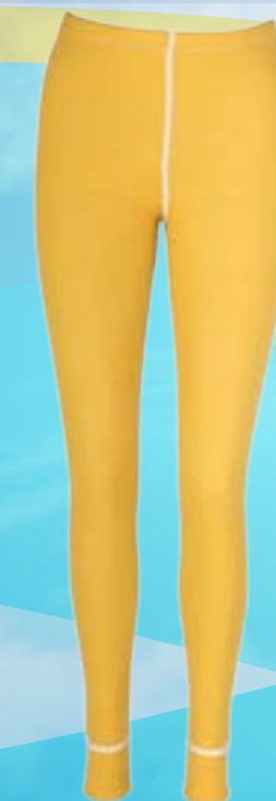
WOOL PANTS 80%VLNA 20%POLYPROPYLÉN OKROVÁ