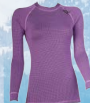
MODAL DLA 70%MODAL 28%POLYPROPYLEN 2%ELASTAN FIALOVÁ S M L XL ART. 85512