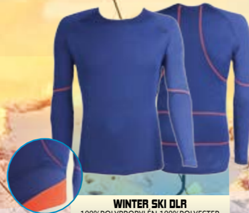
WINTER SKI DLR 100%POLYPROPYLEN 100%POLYESTER MODRÁ/ORANŽOVÁ ♂ S M L XL ART. 85693