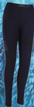
SEAM BIONIC PANTS 54%POLYAMID 40%POLYPROPYLÉN 6%ELASTAN ČIERNA ♀ S/M L/XL ART. 85677