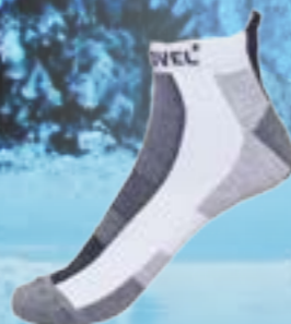
RUNNING 39%COOLMAX 34%POLYAMID 25%POLYAMID MICROLON 2%ELASTAN ČIERNE ♂ 4-5, 6-7, 8-9, 10-11 ART. 10122