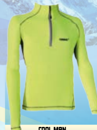
COOL MAN 88%POLYAMID 12%ELASTAN NEÓNOVÁ ♂ M L XL XXL ART. 85665