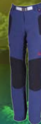
KAIRA 92%POLYAMID 8%SPANDEX MODROČIERNA ART. 85668/1 S M L XL