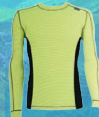
RUN DLR 65%POLYESTER 35%POLYPROPYLÉN NEÓNOVÁ/ČIERNA ♂ M L XL XXL ART. 85670