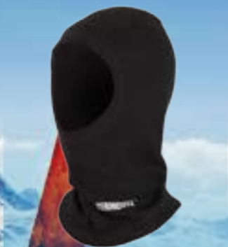
KUKLA 50%BAVLNA 50%POLYPROPYLÉN ČIERNA UNI ART. 85151