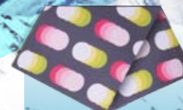
MULTIFUNKČNÝ ŠÁL 95%POLYESTER 5%ELASTAN POTLAČ UNI ART. 85398/5