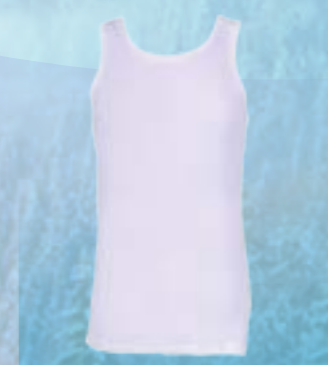
POP SLEEVELESS 100% POLYPROPYLÉN BIELA M L XL XXL XXXL ART. 85623