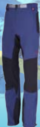
TRIPPER 92%POLYAMID 8%SPANDEX MODROČIERNA ♂ S M L XL XXL ART. 85669/1