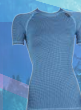
MODAL KRR 70%MODAL 28%POLYPROPYLEN 2%ELASTAN TYRKYSOVÁ S M L XL ART. 85427/4