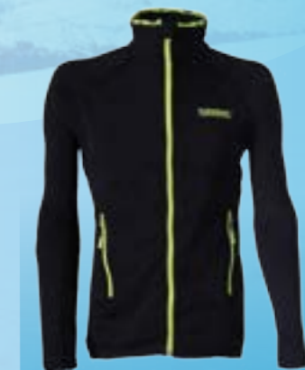
TOM 65%POLYESTER 35%POLYPROPYLEN ČIERNA ♂ M L XL XXL ART. 85697