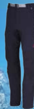
TRIPPER 92%POLYAMID 8%SPANDEX ČIERNA ♂ S M L XL XXL ART. 85669

The microfleece from the Italian company Pontetorto will provide you with optimal wearing comfort, also because it is extremely light. When manufactured, more than 250 thin fibers are applied in just half a millimeter, so it is very pleasant to touch and feels like light cashmere. We believe that Tecnopile® is the most luxurious microfiber currently available. Products from this material are ideal for all sorts of activities and situations.