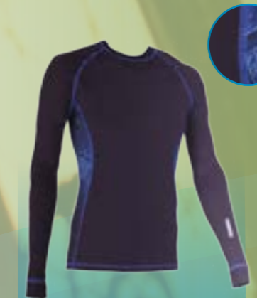
PCE LONG 95%POLYESTER 5%ELASTAN ČIERNA