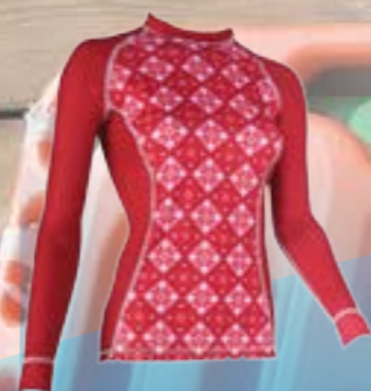
PCE LONG 95%POLYESTER 5%ELASTAN ČERVENÁ S M L XL ART. 85646