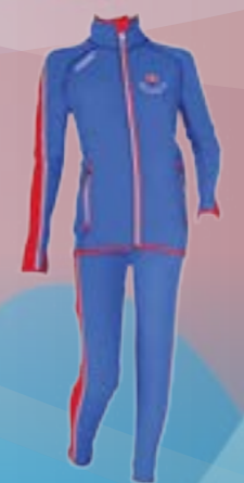
KIDS SLOVAKIA PANTS 86%POLYAMID 14%ELASTAN MODRO ČERVENÁ BIELA 110 120 130 140 150 ART. 85600