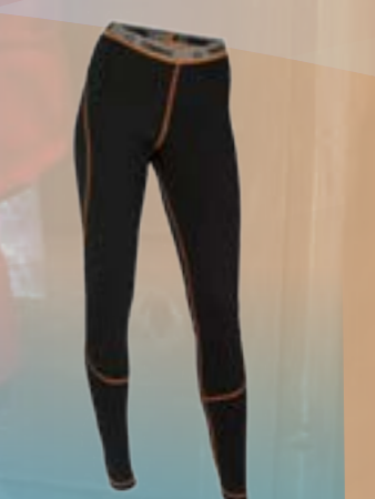
PCE PANTS 95%POLYESTER 5%ELASTAN ČIERNA S M L XL ART. 85528