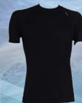
MODAL KAR 70%MODAL 28%POLYPROPYLÉN 2%ELASTAN ČIERNA ♂ M L XL XXL ART. 85517/1