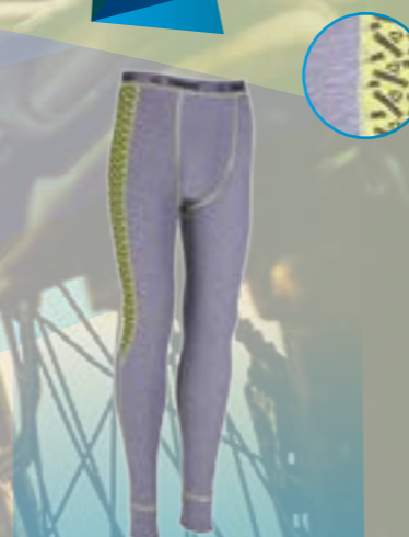
TERM PANTS 95%POLYESTER 5%ELASTAN ŠEDÝ MELÍR