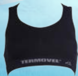
SEAM LADY BRA 54%POLYAMID 40%POLYPROPYLÉN 6%ELASTAN ČIERNA ♀ S/M L/XL ART. 85332