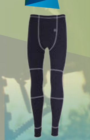
PCE PANTS 95%POLYESTER 5%ELASTAN ČIERNA