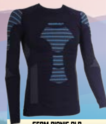
SEAM BIONIC DLR 54%POLYAMID 40%POLYPROPYLEN 6%ELASTAN ČIERNÁ ♂ M/L XL/XXL ART. 85678