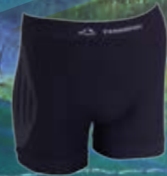
SEAM ACTIVE BOXER 54%POLYAMID 40%POLYPROPYLEN 6%ELASTAN ČIERNÁ ♂ S/M L/XL XXL ART. 85335