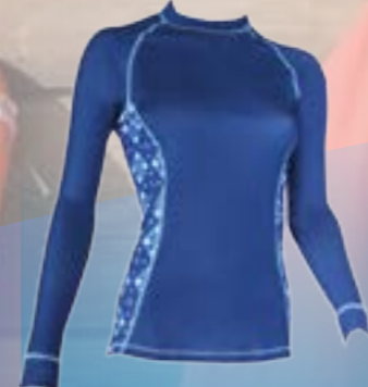
PCE LONG 95%POLYESTER 5%ELASTAN MODRÁ S M L XL ART. 85646/1