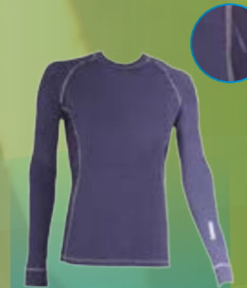
PCE LONG 95%POLYESTER 5%ELASTAN GRAFITOVÁ