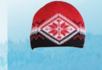
RED 50%VLNA MERINO 50%POLYACRYL ČERVENO-ČIERNA M L ART. 85627