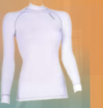
PCE LONG 95%POLYESTER 5%ELASTAN BIELA S M L XL ART. 85527/1