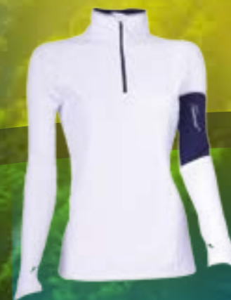
DAKOTA 86%POLYAMID 14%ELASTAN BIELA/TMAVO MODRÁ ART. 85666 S M L XL

Provides high comfort, elasticity, excellent thermal isolation, good air permeability, sweat drainage and has a long lifetime. The material has been developed using the most recent and innovative technology currently available. The knitting technology prevents ladder formation even when highly stretched. The high-quality yarn and its treatment guarantee excellent anti-peeling properties. Clothing from this material is ideal for sports, as well as outdoor, cycling, jogging, cross-country skiing, golf, skiing, and various other sports.