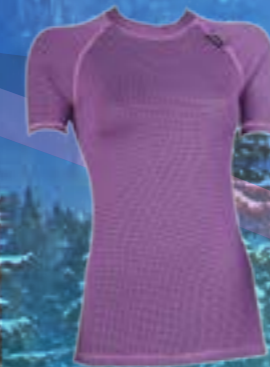
MODAL KRR 70%MODAL 28%POLYPROPYLEN 2%ELASTAN FIALOVÁ S M L XL ART. 85427/3