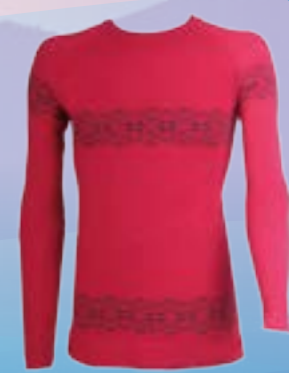
SEAM ROYAL DLR 50%POLYAMID 38%WOOL MERINO 9%POLYPROPYLEN 3%ELASTAN ČERVENÁ ♂ M/L XL/XXL ART. 85680