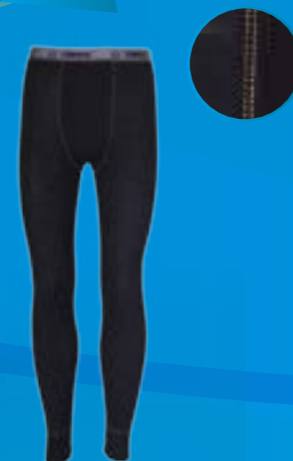
ACTIVE PANTS 100%VLNA ČIERNÁ ♂ S M L XL XXL ART. 85692